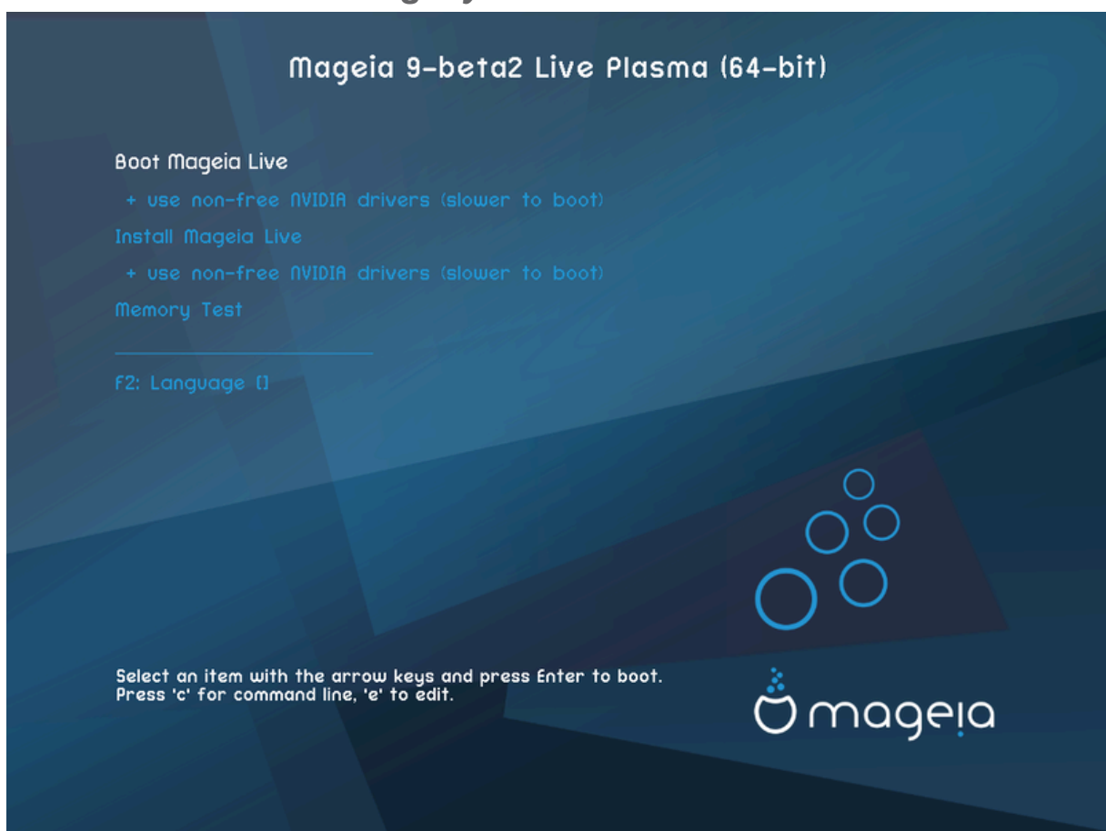
Primeira tela durante a inicialização no modo BIOS