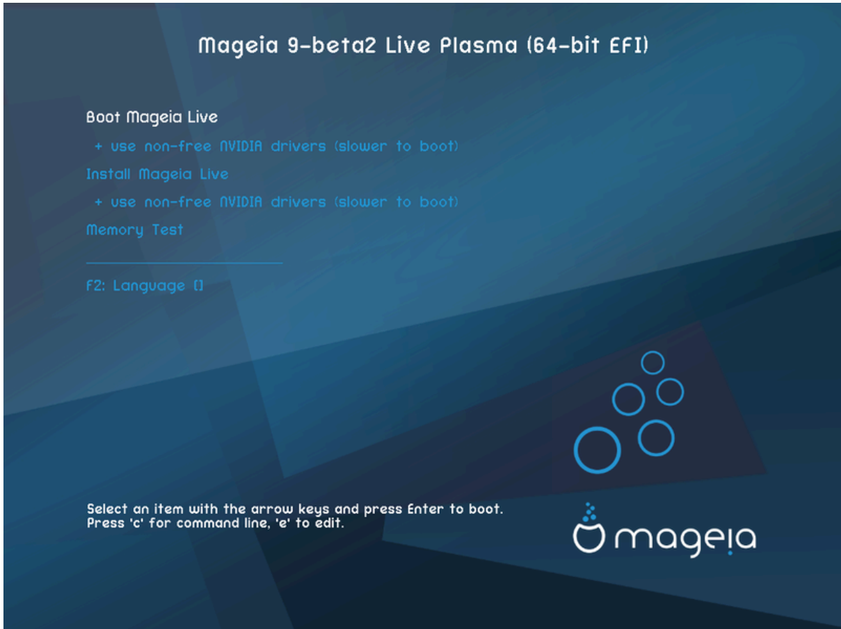
Primera pantalla al arrancar en modo UEFI